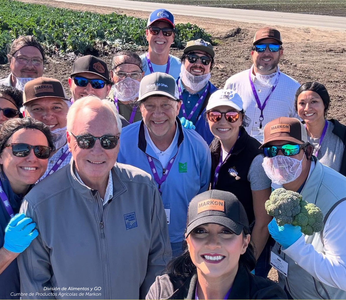
División de Alimentos y GO Cumbre de Productos Agrícolas de Markon

Consulte la lista de proveedores de beneficios y de contactos al hacer clic en Contacts (Contactos) en el menú principal en bek.family .